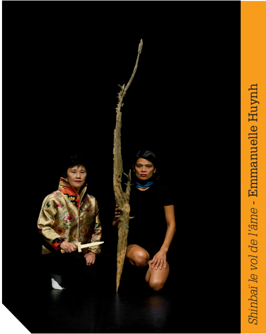
Shinbai le vol de l'âme - Emmanuelle Huynh